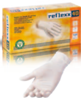
REFLEXX 40 lattice | latex sp. | thk: 0.09 mm