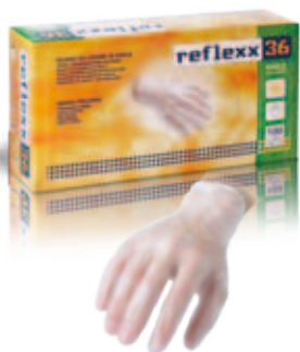
REFLEXX 36 vinile | vinyl sp. | thk: 0.07 mm