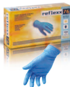
REFLEXX 76 nitrile | nitrile sp. | thk: 0.07 mm

EN 374-3: LA NORMATIVA definisce la resistenza del guanto alla permeazione di prodotti chimici non gassosi. La permeazione valuta per ogni composto chimico l'assorbimento dall'ambiente esterno al guanto, ma anche il successivo rilascio dal guanto alla mano dell'operatore. La resistenza del guanto alla permeazione si valuta come tempo di passaggio della sostanza chimica attraverso il materiale del guanto in condizioni di laboratorio specificamente descritte nella normativa.