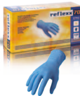
REFLEXX 70 nitrile | nitrile sp. | thk: 0.10 mm